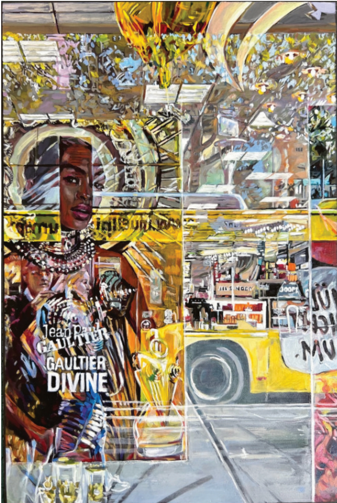
Monika Geisbüsch / Divine, 2025, Öl auf Farbkarton, 30×20 cm