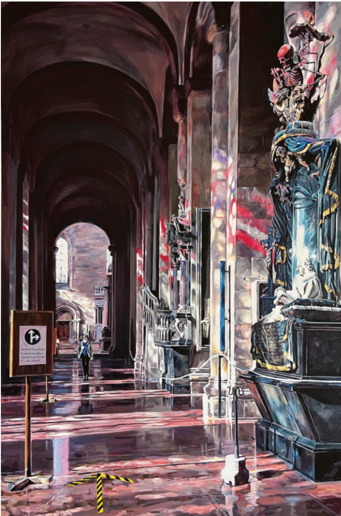
Monika Geisbüsch / Einbahnstraße (Dom zu Mainz), 2021, Acryl auf Leinwand, 150×100 cm