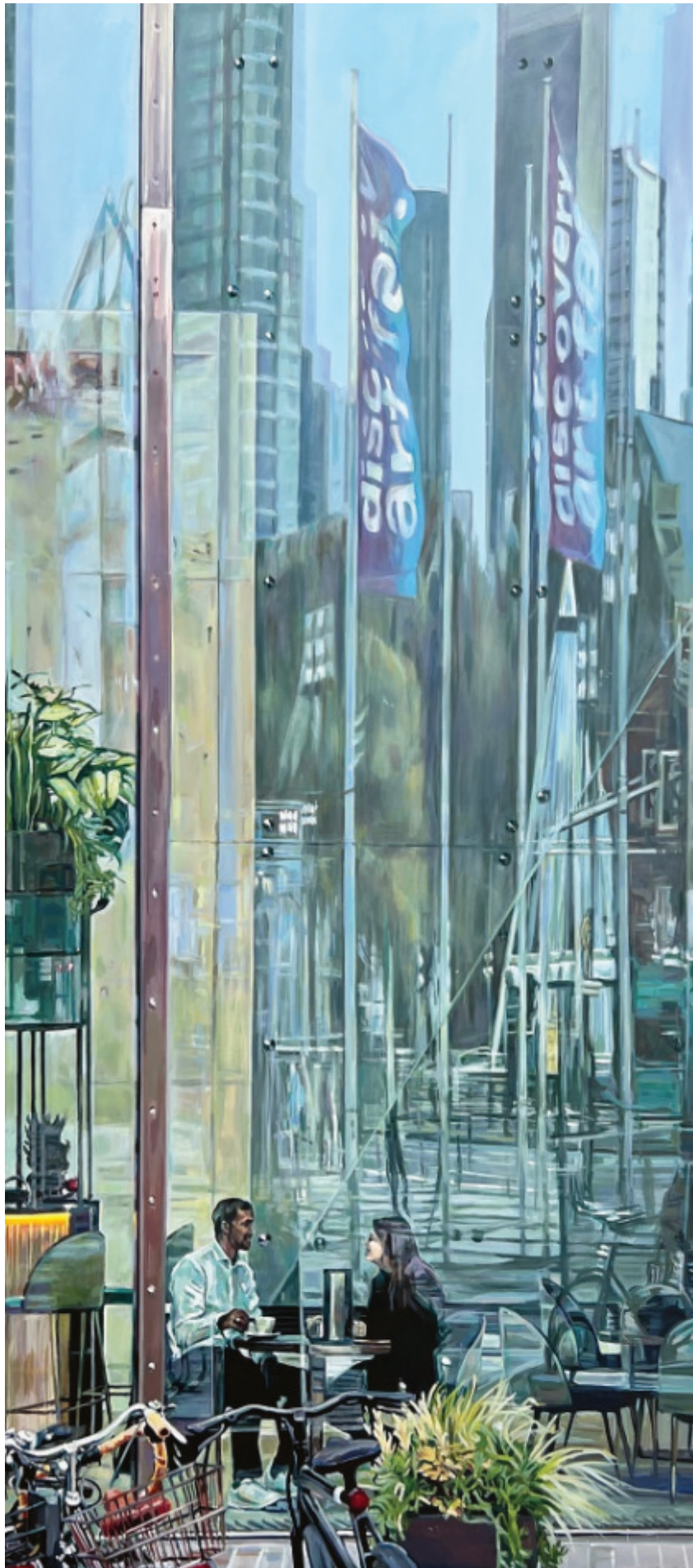
Monika Geisbüsch / Frankfurt, 2025, Acryl auf Leinwand, 180×80 cm