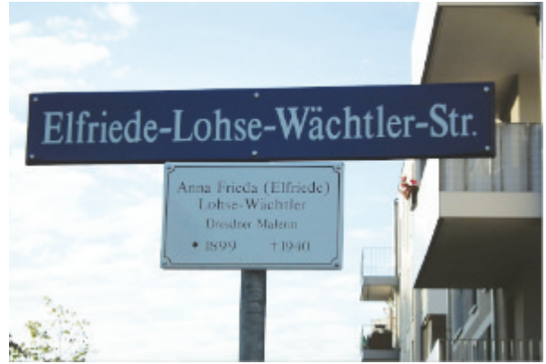
Straßenwidmung in Dresden

Erst im Jahr 1989 erfolgt die öffentliche Anerkennung ihrer Werke im Rahmen einer Präsentation in Reinbek bei Hamburg. Im Jahr 1994 wurde der Förderkreis „Elfriede Lohse-Wächtler e. V.“ gegründet. Es folgen Ausstellungen in Dresden, Hamburg-Altona und Aschaffenburg. Ein Dokumentarfilm entsteht. Im Jahr 1999 wurde zum Gedenken an Elfriede Lohse-Wächtler im Sächsischen Krankenhaus Arnsdorf eine Stele errichtet und ein Stationshaus nach ihr benannt. In Pirna-Sonnenstein wurde der Malerin 2005 eine Straße gewidmet, 2008 folgte eine Straße in Arnsdorf. Ebenso wurde ihr ein Rosengarten in Hamburg gewidmet mit einer Gedenktafel. Auch ein Stolperstein erinnert seit 2012 in Dresden an das Leben der Künstlerin.