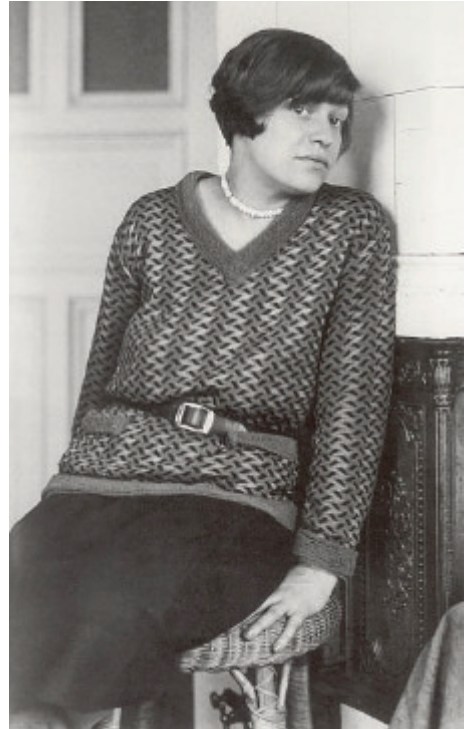
Porträtaufnahme vor dem Kachelofen (um 1928)