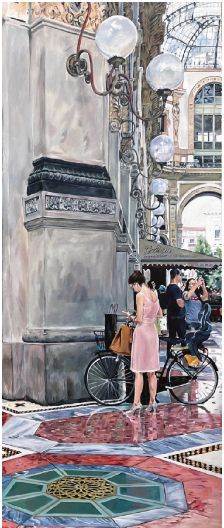
Monika Geisbüsch / Milano Galleria, 2020, Acryl auf Leinwand, 240×100 cm

Monika Geisbüsch im Internet: www.monika-geisbuesch.de Instagram: monika.geisbuesch