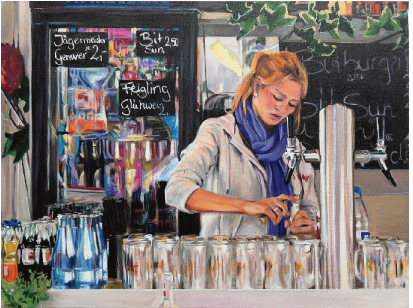
Monika Geisbüsch / Feigling, 2013, Acryl auf Leinwand, 60×80 cm