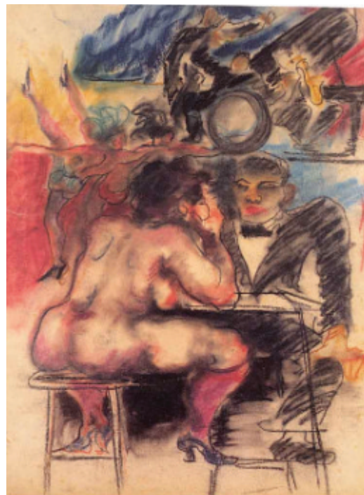
St. Pauli (1930)

Man nennt sie jetzt in einem Atemzug mit Otto Dix, Oskar Kokoschka und Egon Schiele. Während George Grosz oder Otto Dix die Spießler karikierten und die herrschende Klasse vorführten, bewahrte sich Elfriede Lohse-Wächtler einen mitfühlenden Blick auf die Menschen am Rande der Gesellschaft. Immer wieder selbst von Armut und sozialem Abstieg bedroht, sucht sie als scharfe Beobachterin Kneipen, Hinterhöfe und Bordelle auf, um schonungslos ehrlich die Schattenseiten der „Goldenen Zwanziger“ zu dokumentieren und selbstbewusst in männlich dominierte Sperrbezirke von St. Pauli vorzudringen.