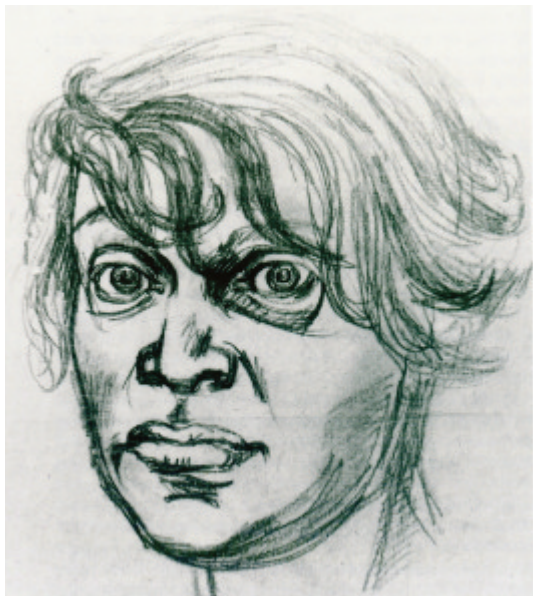
Selbstbildnis in Friedrichsberg (Februar 1929)

Nachdem es 1926 zur Trennung des Paares kommt und verstärkt durch die einsetzende Weltwirtschaftskrise 1929, lebte Elfriede Lohse-Wächtler in großer Armut, erlitt schließlich einen Nervenzusammenbruch und wurde in die Staatskrankenanstalt Hamburg-Friedrichsberg eingewiesen. Es entsteht die Portrait-Reihe „Friedrichsberger Köpfe“, die im Stil der „Neuen Sachlichkeit“ vom Leben und Alltag der Menschen